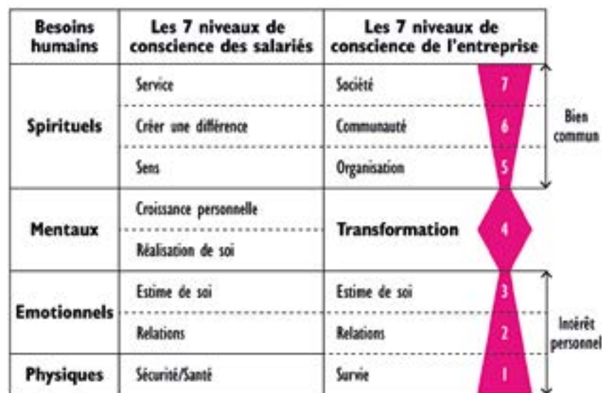
Relation entre les 7 niveaux de consciences des salariés et les 7 niveaux de conscience corporate

Ce qui est particulièrement intéressant à cerner, c'est que, ce qui détermine les niveaux de conscience auxquels se trouvent les travailleurs et leur organisation, ce sont les valeurs qu'ils prônent. Par exemple, la valeur stabilité financière répond à un besoin physique et se situe au niveau 1 de la conscience. En revanche, la valeur conscience environnementale se situe à un niveau de conscience supérieur car il dépasse largement l'intérêt individuel. Nous en arrivons à une compréhension plus subtile du management par les valeurs. En se dotant de valeurs organisationnelles qui tendent vers le bien commun (10) , une organisation offre à ses travailleurs l'opportunité d'accéder à des niveaux de conscience élevés et ainsi, de répondre à des besoins humains plus profonds (11) . Un travailleur social d'une ONG de développement – dont la solidarité est une valeur centrale – affirme lors d'une interview: «Je me sens vraiment citoyen du monde et je veux réaliser ça dans mon boulot (12) ». Autrement dit, ce type de management permet une symbiose entre les travailleurs et leur lieu de travail, devenant alors un lieu d'expression de leurs convictions personnelles.